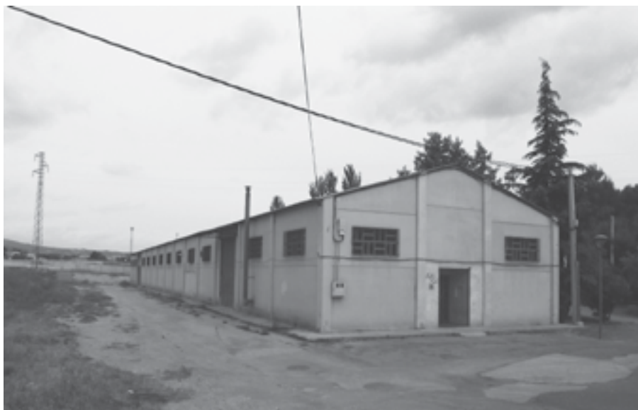
Nave municipal grande para depositar los residuos.