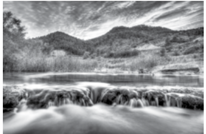
Ionel Albulescu. “Atardeanochecer”

Casa de Cultura de Aguaviva, haciéndose entrega de los diferentes premios establecidos a los ganadores, así como de detalles conmemorativos a todos los participantes y colaboradores. Posteriormente, se proyectó un resumen de la comparecencia en las Cortes de Aragón del Ayuntamiento y la Plataforma el pasado 26 de noviembre.