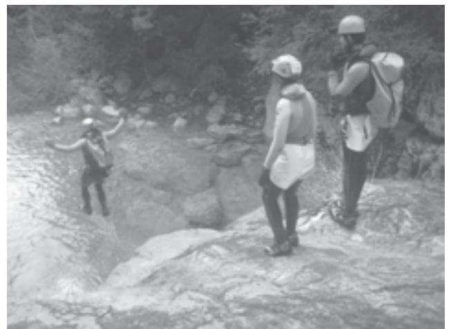
Barranco Canal del Baco