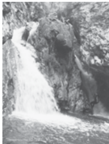
Barranco del Coll Redó + Carboneres

Este año pasado se realizaron barrancos en la zona de Els Ports, nada que envidiar a los barrancos del Pirineo, porque aunque normalmente los encuentras secos y con poco caudal, como fue un invierno lluvioso y nieve abundante, bajaban con agua y estaban muy bonitos.