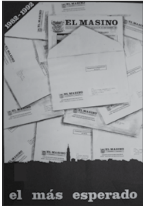
Póster del 10º Aniversario de El Masino

Así pues esperamos que pueda seguir apareciendo El Masino, tras este último número de 2013 que por fin tienes en tus manos.