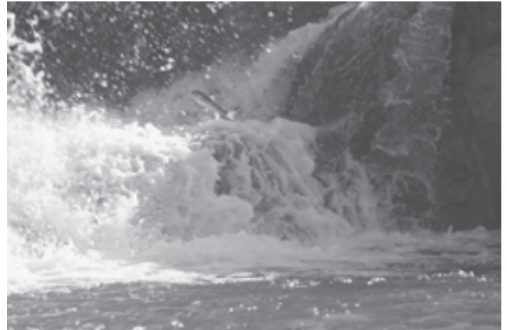
Omar Retavé. “Remontando el Bergantes”

El trabajo de la Plataforma tampoco descansó en las fechas centrales de la Navidad, así el sábado 28 de diciembre tuvo lugar la entrega de premios del I Concurso de Fotografía “El Bergantes no se toca”, organizado por este colectivo. El acto se celebró en la